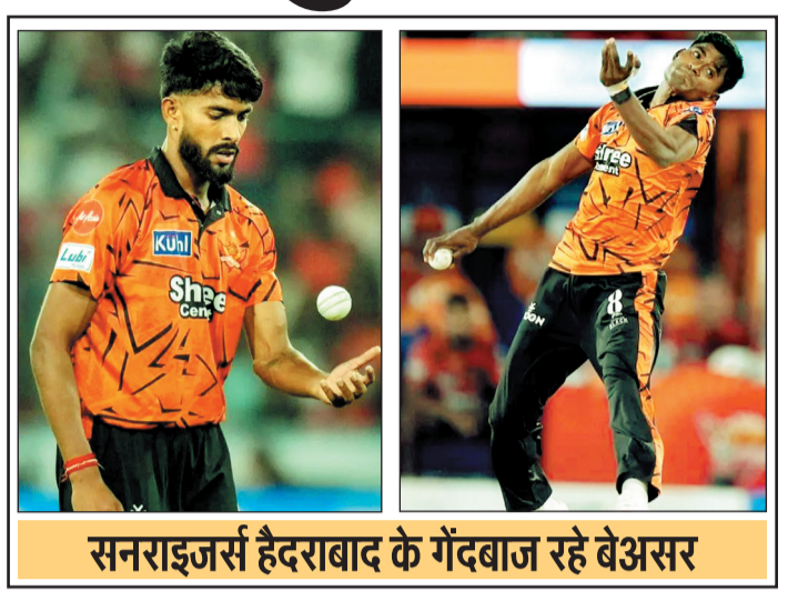
सनराइजर्स हैदराबाद के गेंदबाज रहे बेअसर