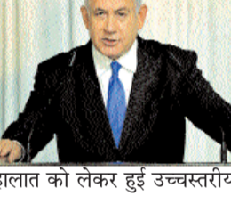
हालात को लेकर हुई उच्चस्तरीय

खतरे को लेकर गंभीर चेतावनी दी है। उन्होंने स्पष्ट कहा कि भले ही इजरायली सेना ने कई बड़े खतरों को खत्म कर दिया हो, लेकिन 122 मिमी रॉकेट और ड्रोन अब भी देश की सुरक्षा के लिए बड़ी चुनौती बने हुए हैं। लेबनान सीमा पर सुरक्षा