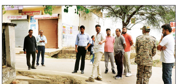
तालाब में सुरक्षा व्यवस्था की और सुदृढ़ करने के लिए एक अतिरिक्त सुरक्षाकर्मी तैनात करने के निर्देश दिए. साथ ही कचरे के ढेरों के शीघ्र उठाव हेतु समय निर्धारण कर नियमित सफाई

इस दौरान उन्होंने वार्ड क्रमांक 13 नेहरू नगर, रतहरा, कोय्ठा डीपिंग साइट, रतहरा तालाब, रानी तालाब एवं विछिया एसटीपी का निरीक्षण कर संबंधित अधिकारियों को आवश्यक दिशा-निर्देश दिए. निरीक्षण के दौरान निगम आयुक्त ने रतहरा