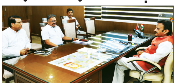
हवाई मार्ग से जोड़ने के लिए सतत प्रयास किए जा रहे हैं. उप

यहाँ के संसाधनों और क्षमताओं के अनुरूप अधोसंरचना का भविष्योन्मुखी विस्तार किया जा रहा है. रीवा को नवीन गंतव्यों से