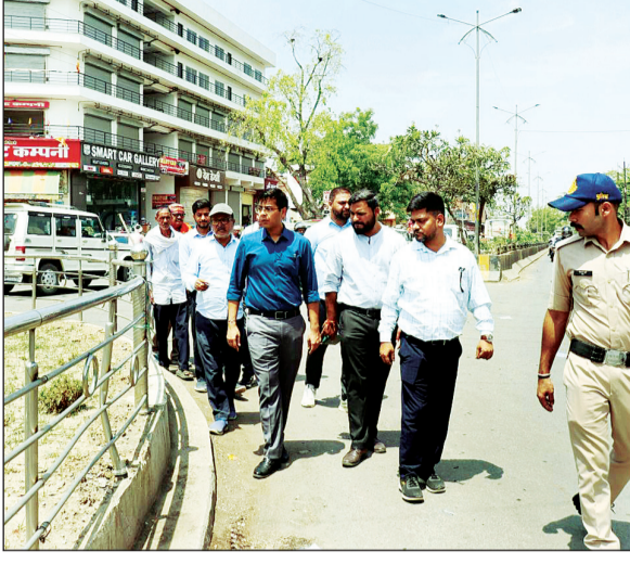
पिछले कई माह से लगातार सड़कों पर जाम लग रहा है जिससे लोग हलाकान हैं और बिगड़ी यातायात व्यवस्था को लेकर उपमुख्यमंत्री को

44 डिग्री तापमान के बीच दोनों अधिकारी विभिन्न चौराहों में नजर आए. एक ओर जहां वाहन चालकों को समझाईश दी. वहीं तैनात पुलिसकर्मियों को ट्राफिक व्यवस्था को लेकर निर्देश दिये. बेपटरी हो चुकी यातायात व्यवस्था को पटरी पर लाने की कवायत शुरू कर दी गई