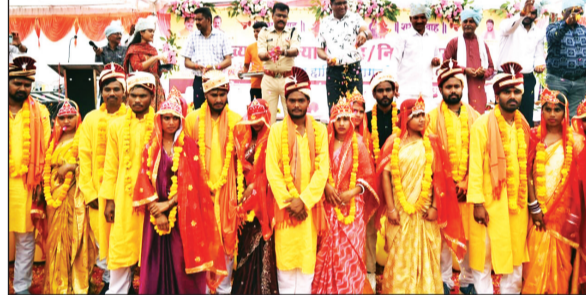
बीच अंगन को साक्षी मानकर फेरें लिए, वहीं दूसरी ओर निकाह की रस्मों को भी पूरी धार्मिक शुचितता के साथ संपन्न कराया गया. प्रशासन द्वारा सर्वधर्म समभाव

समारोह में जिले के विभिन्न क्षेत्र से आये जोड़ों ने वैदिक मंत्रोंच्चार और सामाजिक रीति रिवाज के साथ गृहस्थ जीवन में प्रवेश किया. आयोजन के दौरान पूरा परिसर उत्सव के रंग में सराबोर नजर आया. जहाँ एक ओर हिंदू जोड़ों ने पंडितों द्वारा उच्चारित वैदिक ऋचाओं के