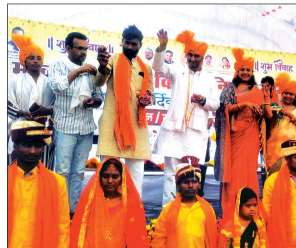
सामूहिक विवाह सम्मेलन में जोड़े पर पुष्पवर्षा करते सिरमौर विधायक