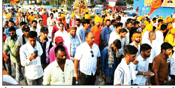
थे. इसी तरह परशुराम आश्रम इटौरा में भी सुंदरकांड का पाठ कर परशुराम भगवान का जन्मोत्सव पूरे उत्साह के साथ मनाया गया. विवेकानंदन पार्क से

जगह-जगह शोभा यात्रा का स्वागत किया गया. तेज धूप के बावजूद लोग नहीं रुके और शोभा यात्रा में नाचते हुए चल रहे