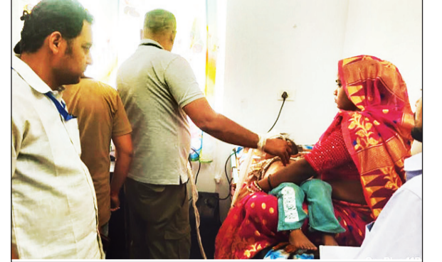
नवभारत न्यूज सीधी 18 अप्रैल। जिला चिकित्सालय परिसर स्थित जिला शोध हस्तक्षेप केन्द्र भवन में हृदय रोग से संबंधित विशेष स्वास्थ्य शिविर का आयोजन किया गया। मुख्य चिकित्सा एवं स्वास्थ्य अधिकारी एवं जिला प्रशासन के निर्देशन में आयोजित इस शिविर में लगभग 120 हितग्राहियों ने पंजीयन कराकर स्वास्थ्य लाभ प्राप्त किया।

संबंधित व्यक्ति का कार्य नहीं हुआ तो वह कलेक्टर से उनके मोबाइल पर भी सीधे शिकायत कर सकते हैं। कलेक्टर गांव-गांव में प्राथमिकता से भ्रमण कर रहे हैं और वहां की वस्तुस्थिति की जानकारी जनता से सीधा संवाद कर ले रहे हैं। अपने भ्रमण के दौरान कलेक्टर वहां चल रहे सरकारी निर्माण कार्यों का निरीक्षण भी कर रहे हैं, साथ ही निर्माण कार्यों को पूरी गुणवत्ता के साथ सुनिश्चित करने का निर्देश दे रहे हैं।