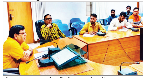
को उपलब्ध कराया गया है। सर्वेयर्स को निर्देशित किया गया कि किसानों से प्राप्त स्कंध (उपज) की गुणवत्ता की प्रविष्टि सर्वेयर ऐप पर अनिवार्य रूप से करें तथा शासन द्वारा निर्धारित मापदंडों का कड़ाई से पालन सुनिश्चित कराएं। सभी सर्वेयर्स को यह भी निर्देश दिए गए कि उनके पास गुणवत्ता जांच किट अनिवार्य रूप से उपलब्ध हो तथा प्रत्येक किसान से प्राप्त एवं परिवहन किए गए स्कंध का नमूना सुरक्षित रखा जाए एवं उसका विधिवत अभिलेख (पंजी) संधारित किया जाए। अधिकारियों ने स्पष्ट किया कि खरीदी उपरांत उपार्जित गेहूं की गुणवत्ता से संबंधित किसी भी प्रकार की शिकायत पाए जाने पर संबंधित सर्वेयर को जवाबदेही निर्धारित की जाएगी। गुणवत्ता में किसी भी प्रकार की लापरवाही पर कड़ी कार्रवाई सुनिश्चित की जाएगी।

नवभारत न्यूज सीधी 18 अप्रैल। प्रभारी जिला आपूर्ति अधिकारी ने बताया कि रबी विपणन वर्ष 2026-27 में समर्थन मूल्य पर उपार्जित गेहूं की गुणवत्ता एवं नियंत्रण सुनिश्चित करने हेतु 16 अप्रैल को अपर कलेक्टर की अध्यक्षता में कलेक्टर सभागार में बैठक आयोजित की गई। बैठक में बताया गया कि सभी सर्वेयर्स को आर.को. एसोसिएट्स के माध्यम से खरीदी एजेंसी नागरिक आपूर्ति निगम जिला सीधी