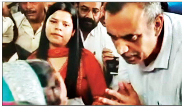
शुरू कर दिये। कलेक्टर की प्रशासनिक कार्यों को लेकर न्याय कार्यशैली से जहां आम जनता में की उम्मीद जगी है वहीं

साथ जमीन पर बैठकर सीधे जनसुनवाई कर रहे हैं और लापरवाही बरतने वाले अधिकारियों को कड़ी फटकार लगा रहे हैं। विधानसभा क्षेत्र धौहनी के नेबूहा में आज आयोजित स्वास्थ्य शिविर के दौरान बहनों से संवाद के दौरान कलेक्टर सीधी विकास मिश्रा ने कहा कि मैं अधिकारी नहीं, नौकर हूँ, मालिक आप लोग हैं। कलेक्टर का यह उद्गार सुनकर वहां मौजूद लोग भी उनके सरल एवं सहज स्वभाव की तारीफ करना