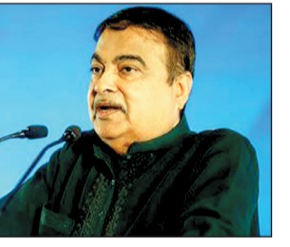
जाम की स्थिति से निपटने के लिए परियोजना को मंजूरी

दिल्ली देहरादून एक्सप्रेस वे के उद्घाटन समारोह को संबोधित करते हुए गडकरी ने कहा कि इस परियोजना में पर्यावरण का विशेष ध्यान रखा गया है और वन्यजीवों