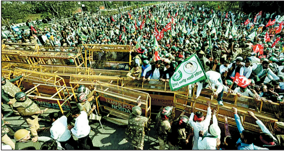
श्रमिकों को खुशखबरी- वेतन बढ़ोतरी का ऐलान

इस दौरान कुछ श्रमिकों द्वारा पुलिस पर पत्थरबाजी की भी खबर सामने आई, जिसके बाद हालात को नियंत्रित करने के लिए भारी पुलिस बल तैनात किया गया. यह विरोध ऐसे समय में सामने आया है जब उत्तर प्रदेश सरकार ने हाल ही में न्यूनतम मजदूरी में बढ़ोतरी का ऐलान किया है.