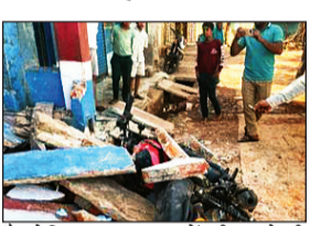
है, लेकिन सुरक्षा मानकों की अनदेखी की जा रही है। रास्ते पर खड़े गए गहरे गड्ढों को लेकर पहले भी चिंता जताई गई थी, लेकिन कोई ठोस उपाय नहीं किए गए। बताया गया है कि पाइपलाइन

नवभारत न्यूज सतना, 14 अप्रैल. मैहर शहर के वार्ड क्रमांक 9, पुरानी बस्ती उत्तर दरवाजा क्षेत्र में सौर लान्ड निर्माण के दौरान हुए विस्फोट से एक मकान क्षतिग्रस्त हो गया। इस घटना में घर में रखी शादी में देहेज के लिए रखी एक नई बुलेट बाइक मलबे में दबकर खराब हो गई। परिजनों के अनुसार, क्षेत्र में सीवर लाइन खलने का कार्य चल रहा