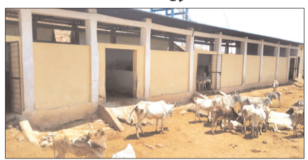
स्तर पर स्थिति बेहद चिंताजनक है. गौशाला में रखे गए गौवंशों को ना तो पर्याप्त पानी मिला पा रहा है और ना ही

नवभारत न्यूज गुड़, 10 अप्रैल, गुड़ विधानसभा क्षेत्र अंतर्गत ग्राम पंचायत गोरगी स्थित संचालित सरकारी गौशाला को लेकर गंभीर लापरवाही का मामला सामने आया है।