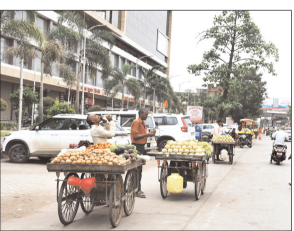
सिरमौर चौराहा बाल भारतीय स्कूल के सामने सड़क पर लगे फल के डेले

किया कि वे अपने-अपने क्षेत्रों में बकाया करों की सूची तैयार कर उसका नियमित अनुश्रवण करें तथा वसूली की प्रगति की साप्ताहिक समीक्षा करें. साथ ही करदाताओं को जागरूक करने के लिए व्यापक प्रचार-प्रसार अभियान चलाएं.