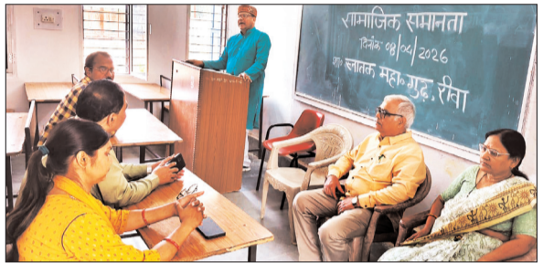
सामाजिक समरसता पर आयोजित हुई संगोष्ठी