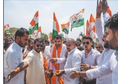
और एक साथ मिलकर काम करने का भी संदेश कार्यकर्ताओं को देकर गये।