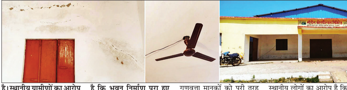
है। स्थानीय ग्रामीणों का आरोप

नवभारत न्यूज सिंगरौली, 5 अप्रैल। चितरंगी विकासखंड के ग्राम पंचायत खैरा अंतर्गत फुलकेश गांव में वर्ष 2022-23 में एनसीएल अमलोरी परियोजना द्वारा सीएसआर मद से करीब 90 लाख रुपये की लागत से निर्मित सामुदायिक भवन अब गंभीर सवालियों के घरे में आ गया