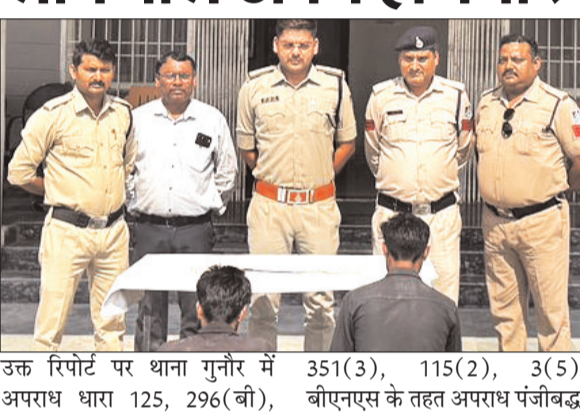
उक्त रिपोर्ट पर थाना गुनौर में अपराध धारा 125, 296(बी), 351(3), 115(2), 3(5) बीएमएस के तहत अपराध पंजीबद्ध