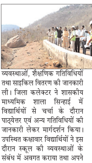
संस्था प्रमुख से शिक्षक व विद्यार्थियों की नियमित उपस्थिति के साथ विद्यालय की मूलभूत