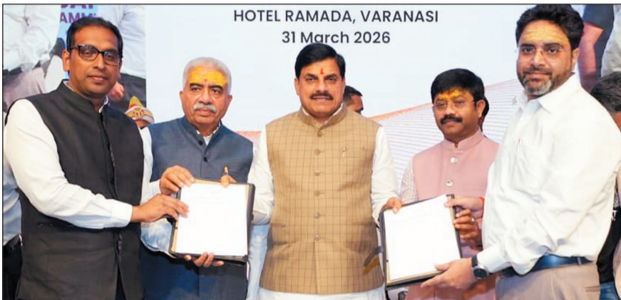
HOTEL RAMADA, VARANASI 31 March 2026

दोनों राज्यों के बीच भौगोलिक रिश्ते होने के साथ सांस्कृतिक, आध्यात्मिक और ऐतिहासिक संबंध रहे हैं. उत्तर प्रदेश और मध्यप्रदेश साझा विरासत के साथ आगे बढ़ रहे हैं. इस क्रम में आज आयोजित एमपी-यूपी सहयोग सम्मेलन भविष्य की संभावनाओं को आधार प्रदान करेगा. मुख्यमंत्री डॉ. यादव मंगलवार को बनारस