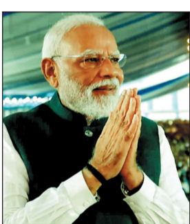
नरेंद्र मोदी के सीएम और पीएम के रूप में 8931 दिन हुए पूरे

नई दिल्ली, 22 मार्च. भारतीय राजनीति में एक ऐतिहासिक उपलब्धि दर्ज की गई है। प्रधानमंत्री नरेंद्र मोदी ने सिक्किम के पूर्व मुख्यमंत्री पवन कुमार चामलिंग को पीछे छोड़ते हुए भारत में सबसे लंबे समय तक सरकार के प्रमुख रहने का रिकॉर्ड बना लिया है। पवन कुमार चामलिंग ने 8,930 दिनों तक मुख्यमंत्री के रूप में कार्य किया। जबकि प्रधानमंत्री मोदी ने गुजरात के मुख्यमंत्री और प्रधानमंत्री कार्यकाल को मिलाकर 8,931 दिन पूरे कर लिए हैं। यह एक