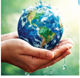
आज विश्व जल दिवस है.