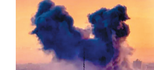
अंतरराष्ट्रीय परमाणु सुरक्षा मानकों का उल्लंघन करती हैं.

तेहरान, 21 मार्च (वार्ता) इजरायल-अमेरिका और ईरान के बीच 22 दिनों से जंग जारी है. शनिवार को इजरायल-अमेरिका ने ईरान के नतान्ज में यूरेनियम संवर्धन केंद्र पर हमले किए, हालांकि किसी भी रेडियोधर्मी रिसाव की सूचना नहीं मिली है. ईरान के परमाणु ऊर्जा संगठन (एईओआई) ने इस हमले की जानकारी देते हुए बताया. नतान्ज में शहीद अहमद रौशन यूरेनियम संवर्धन केंद्र पर सुबह के समय हमला किया गया. एजेंसी ने कहा कि किसी भी रेडियोधर्मी रिसाव का पता नहीं चला है और आसपास की आबादी के लिए कोई खतरा नहीं है. इसने हमले की निंदा करते हुए यह भी कहा कि इस तरह की कारवाइयां