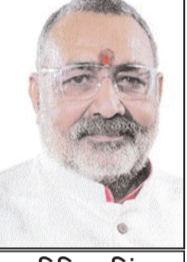
विकसित भारत बजट 2026-27 वैश्विक अनिश्चितता के दौर में आत्मविश्वास, दृढ़ संकल्प और स्पष्ट सुधारोन्मुख दृष्टिकोण की ओर इंगित करता है. भारत आज विश्व की चौथी सबसे