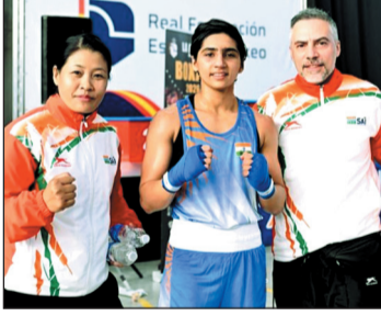
सेविला में होगा हाई-वोल्टेज मुकाबला जीतने वाली टीम सेमीफाइनल में जाएगी