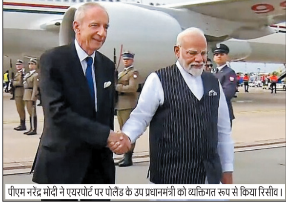
पीएम नरेंद्र मोदी ने एयरपोर्ट पर पोलैंड के उप प्रधानमंत्री को व्यक्तिगत रूप से किया रिस्वील।

करने की नीति अपनानी चाहिए और हमारे पड़ोस में आतंकवादी दलों को किसी भी प्रकार से सहायता नहीं करनी चाहिए.