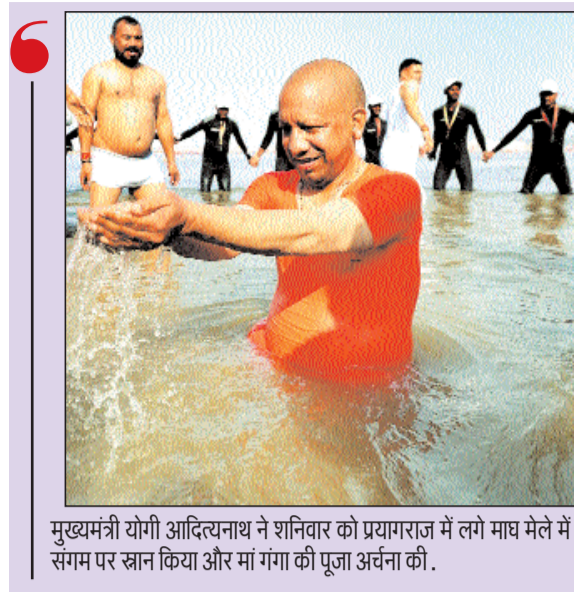
मुख्यमंत्री योगी आदित्यनाथ ने शनिवार को प्रयागराज में लगे माघ मेले में संगम पर स्नान किया और मां गंगा की पूजा अर्चना की।

उन्होंने कहा कि जो लोग आज भी समाज को बांट रहे हैं, वे कभी हितैषी नहीं होंगे। सत्ता में रहने पर यह लोग परिवार के बाहर नहीं सोच पाते थे। यह फिर तमाम नारे देंगे, लेकिन इन्हें जब भी मौका मिलेगा तो वही करेंगे, जो पहले किया था। पहचान का संकेत, अराजकता, सनातन धर्म पर प्रहार और दंगों की आड़ में फिर हर व्यक्ति को शूलसाएंगे। हमें इसकी पुनरावृत्ति नहीं होने देनी चाहिए, डबल इंजन सरकार सनातन आस्था को मजबूती प्रदान करने के लिए सदैव खड़ी है।