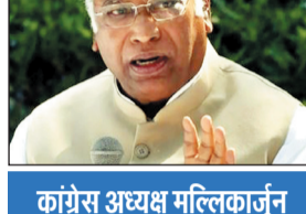
कांग्रेस अध्यक्ष मल्लिकार्जुन खरो ने कहा

लखनऊ, 28 दिसंबर. मुख्यमंत्री योगी आदित्यनाथ ने धर्मांतरण से जुड़े संगठित गिरोहों को नेस्तनाबूद करने के लिए पुलिस और खुफिया एजेंसियों को आर्टिफिशियल इंटेलिजेंस और आधुनिक तकनीक के प्रभावी इस्तेमाल के निर्देश दिए. उन्होंने कहा कि विदेशी फंड से संचालित धर्मांतरण नेटवर्क प्रदेश को सामाजिक एकता और सुरक्षा के लिए गंभीर खतरा हैं, जिन पर सख्त और समयबद्ध कार्रवाई