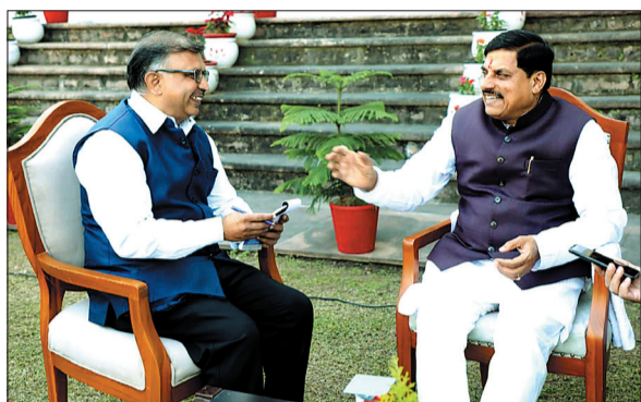
मुख्यमंत्री डॉ. मोहन यादव के साथ नवभारत के समाचार संपादक की विशेष चर्चा.