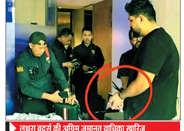
लूथरा ब्रदर्स की अग्रिम जमानत याचिका खारिज

▶ वलब में लगने से 25 लोगों की हुई थी मौत ▶ दिल्ली से थाईलैंड के फुकेट भागे थे दोनों भाई