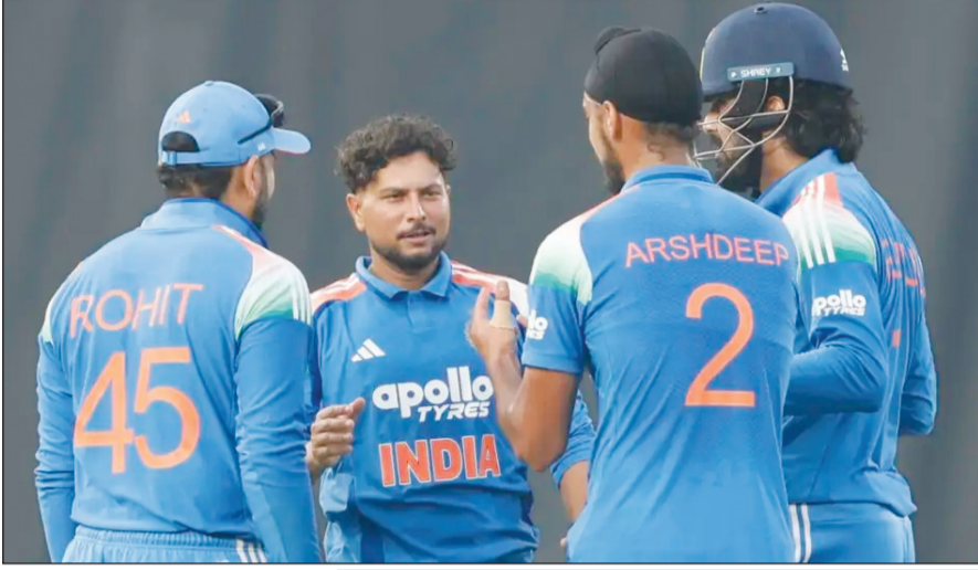
सम्मानजनक स्कोर तक पहुंचाया। हालांकि डिकॉक के अलावा दक्षिण अफ्रीका का कोई भी बल्लेबाज भारतीय गेंदबाजों के सामने टिक नहीं पाया।

दक्षिण अफ्रीका ने टॉस जीतकर बल्लेबाजी चुनी थी और उनके भरोसेमंद बल्लेबाज किंटन डिकॉक ने 106 रनों की शानदार पारी खेलकर टीम को 270 के