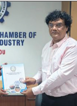
डॉ. अरुलमोद्दीवर्मन को नया कुलपति (प्रभारी) नियुक्त किया।

बनाने के लिए निरंतर कार्य कर रहा है। अहमदाबाद मंडल और गांधीधाम सब-डिवीजन की उत्कृष्ट उपलब्धियों वर्ष 2025-26 के पहले सात माह में 29.18 मिलियन टन माल परिवहन का उल्लेखनीय कीर्तिमान स्थापित किया गया है।