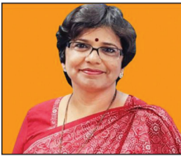
कि शिक्षित महिलाओं को उभरते क्षेत्रों में कहीं अधिक रोजगार

अवसर मिलेंगे। रहाटकर ने ग्रामीण महिलाओं के आर्थिक सशक्तिकरण में प्रगति का जिक्र किया, विशेष रूप से अंडमान एवं निकोबार द्वीप समूह का उदाहरण देते हुए, जहां कम जनसंख्या के बावजूद एक हजार से अधिक लक्षपति दीवियां हैं जो हर साल एक लाख रुपये से अधिक कमाती हैं।