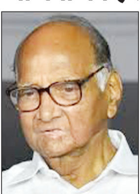
मुंबई. महाराष्ट्र की राजधानी मुंबई की सत्ता पर बीजेपी को काबिज होने से रोकने के लिए शरद पवार पावरगेम खेलेंगे। महाराष्ट्र में राज ठाकरे की अगुवाई वाली मनसे को लेकर

एमवीए की कमान शरद पवार ने अपने हाथों में ली उद्धव ठाकरे की शिवसेना यूबीटी और कांग्रेस के बीच तालीफ बंधने के बाद शरद पवार के खेमे से पावरगेम की तैयारी सामने आई है। मुंबई में बीजेपी के अगुवाई वाली गठबंधन को शिकस्त देने और बीएमसी की सत्ता पर शिवसेना यूबीटी का कब्जा बरकरार रखने के लिए शरद पवार पूरी जोरआजमाइश करेंगे, ताकि विपक्षी एकता बनी रहे और राज ठाकरे को मनसे को भी एमवीए यानी महाविकास आघाड़ी में एंटी मिल जाए। कांग्रेस आलाकमान से करेंगे चर्चा- मुंबई बीएमसी