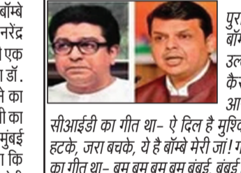
पुराने फिल्म गीतों में भी बॉम्बे या बंबई शब्द का उल्लेख रहा है जिसे कोई कैसे बदलेगा? देव आनंद अभिनेता फिल्म सीआईडी का गीत था- ऐ दिल है मुश्किल जीना यहां, जरा हटके, जरा बचके, ये है बॉम्बे मेरी जाँ! गोविंदा की एक फिल्म का गीत था- बम बम बम बम बंबई, बंबई हमको जम गई.