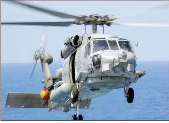
वर्ष के लिए हुए इस समझौते में कलपुर्जे, प्रशिक्षण, तकनीकी सहायता और आवश्यक घटक की मरम्मत एवं आपूर्ति शामिल हैं.