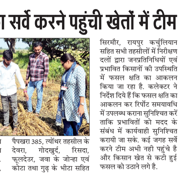
कर्मचारियों के संयुक्त दलों द्वारा खेतों में जाकर फसल क्षति का आकलन किया जा रहा है. तहसील हजुर के ग्राम कुचूर, पैपखरा 385, त्योंथर तहसील के देवरा, गोदखुर्द, रिसदा, फूलदेउर, जवा के जोन्हा एवं कोटा तथा गुढ़ के भीटा सहित