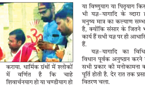
त्रिदिवसीय श्रीशिवार्चनयाग महोत्सव बनारस से पथारे पुरोहितों द्वारा अनुष्ठान संपन्न कराया. धार्मिक ग्रंथों में श्लोकों में वर्णित है कि चाहे शिवार्चनयाग हो या चण्डीयाग हो

नवभारत न्यूज रीवा, 5 नवम्बर, औघड़दास आश्रम यज्ञलोक राधिकापुरी पड़रा में विश्वकल्याणार्थ तीन दिवसीय शिवार्चन और प्रवचन एक धार्मिक अनुष्ठान सम्पन्न हुआ. तृतीय दिवस देव पूजन, हवन, पूर्णाहुति पाश्चात्य भिंडारा के साथ सम्पन्न हुआ. भंडारे में श्रद्धालुओं ने प्रसाद ग्रहण किया.