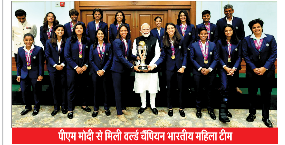
पीएम मोदी से मिली वर्ल्ड चैंपियन भारतीय महिला टीम

अमेरिकी वायुसेना का ग्लोबल स्ट्राइक कमांड ने कैलिफोर्निया से एक बिना हथियार वाली मिनटमैन III अंतरमहाद्वीपीय बैलिस्टिक मिसाइल (आईसीबीएम) का टेस्ट लॉन्च किया. यह रेगुलर टेस्ट था. बता दें कि हाल ही में ट्रंप ने कहा कि रूस, चीन और पाकिस्तान जैसे देश परमाणु परीक्षण कर रहे हैं. इसलिए अमेरिका को पीछे नहीं रहना चाहिए. उन्होंने पेंटागन को तुरंत परीक्षण शुरू करने को कहा. लेकिन ऊर्जा विभाग ने स्पष्ट किया कि अभी विस्फोट वाले परीक्षण नहीं होंगे.