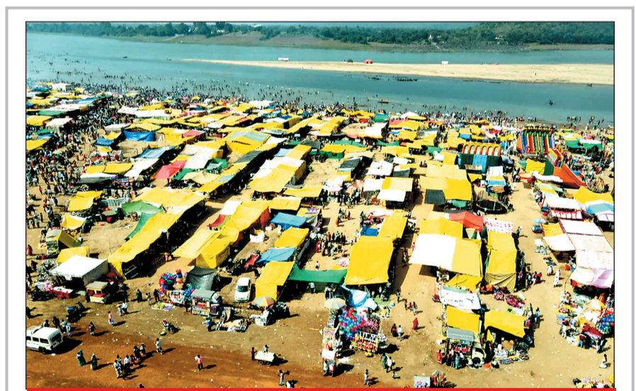
नर्मदा तवा संगम स्थल पर श्रद्धालुओं का उमड़ा सैलाब