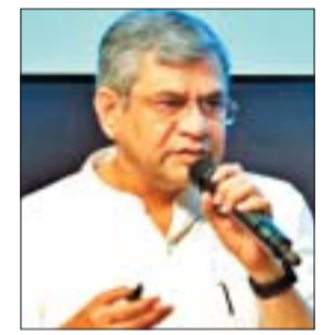
होगी. सूचना प्रसारण मंत्री अश्विनी

नई दिल्ली, 7 अक्टूबर. प्रधानमंत्री नरेन्द्र मोदी की अध्यक्षता में केन्द्रीय कैबिनेट ने महाराष्ट्र, मध्य प्रदेश, गुजरात और छत्तीसगढ़ में चार बड़ी मल्टी ट्रेकिंग रेलवे परियोजनाओं को मंजूरी दी है. इन परियोजनाओं को कुल अनुमानित लागत लगभग 24,634 करोड़ रुपये है और इनका निर्माण 2030-31 तक पूरा होने की उम्मीद है. इन परियोजनाओं से भारतीय रेलवे के मौजूदा नेटवर्क में लगभग 894 किलोमीटर की वृद्धि