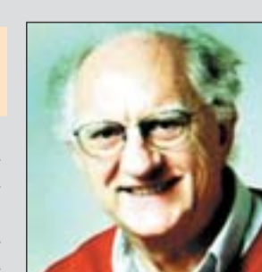
जॉन क्लार्क हुए बताया कि तीनों वैज्ञानिकों को फॉर द डिस्कवरी ऑफ मैक्रोस्कोपिक क्रॉम मैकेनिकल टनलिंग एंड एनर्जी क्रॉसिंग जेशन इन इन इलेक्ट्रिक सर्किट के लिए इस साल का पुरस्कार दिया जा

▶ रॉयल स्वीडिश एकेडमी ऑफ साइंसेज ने स्टॉकहोम में कहा- स्टॉकहोम, 07 अक्टूबर. भौतिक विज्ञान के लिए इस साल का नोबेल पुरस्कार तीन वैज्ञानिकों जॉन क्लार्क, मिशेल देवरे और जॉन एम मार्टिनिस को दिये जाने की घोषणा की गयी है. ये तीनों वैज्ञानिक अमेरिका के कैलिफोर्निया विश्वविद्यालय में कार्यरत हैं. रॉयल स्वीडिश एकेडमी ऑफ साइंसेज ने स्टॉकहोम में मंगलवार को यह घोषणा करते