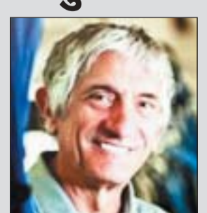
अमेरिका के येल विश्वविद्यालय और कैलिफोर्निया विश्वविद्यालय में पढ़ा रहे हैं. जॉन एम. मार्टिनिस ने 1987 में कैलिफोर्निया विश्वविद्यालय से पीएचडी की थी.