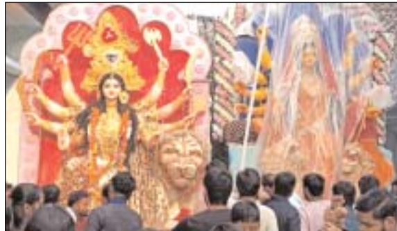
तरफ सराहना की जा रही है। दशहरा के पहले विश्व हिंदू, बजरंग दल नगर इकाई के