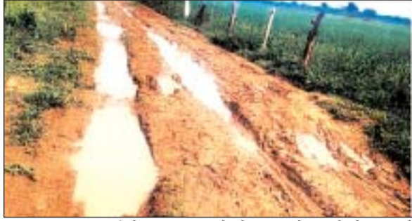
जानकारी के अनुसार देवसर विधानसभा क्षेत्र के बरका

नवभारत न्यूज सिंगरौली 27 सितम्बर। देवसर विकासखण्ड व विधानसभा क्षेत्र के बरका के तेन्दूपता गोदाम से लेकर सर्सा टोला स्कूल तक लम्बाई दूरी करीब 4 किलोमीटर दल-दल कीचड़ सड़क में इन दिनों पैदल भी चलना जोरिखम भरा साबित हो रहा है। इस मार्ग से करीब आधा दर्जन गांवों के लोगों का आना-जाना होता है।