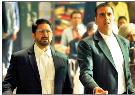
का जॉली (जॉली एलएलबी का लीड) एक ही केस पर आगे-आगे हैं। दोनों अपनी-अपनी नैतिकता और एथिक्स के मानदंडों के साथ टेक्निकल लूपहोल्स ढूँढते हुए केस लड़ते हैं, और बीच में यह सवाल उठता है कि असली और ज्यादा महत्वपूर्ण जॉली कौन है। पहली फिल्म में क्लास डिस्ट्रिब्यूट और सोशल जस्टिस पर फोकस था, जबकि सीकवल में बेगुनाह नागरिक पर गलत आरोप का मुद्दा था। दोनों फिल्मों का एकमात्र कॉमन कैरेक्टर जज सुंदर लाल त्रिपाठी है, जिसे सौरभ शुक्ला निभा रहे हैं।

फिल्म का ओवरऑल हिंदी ऑक्जुपेंसी 35.40 प्रतिशत रहा, जिसमें मॉर्निंग शो में 13.65 प्रतिशत, आफ्टरनून में 32.38 प्रतिशत, ईवनिंग में 40.47 प्रतिशत और नाइट शो में 55.10 प्रतिशत दर्शक दर्ज किए गए। दिल्ली-एनसीआर में 1313 शो के साथ सबसे ज्यादा स्क्रीनिंग हुई, उसके बाद मुंबई में 733 शो। जॉली एलएलबी 3% फ्रेंचाइजी का तीसरा भाग है, जिसमें पहली बार अक्षय कुमार का जॉली (जॉली एलएलबी 2 का प्रोटागोनिस्ट) और अरशद वारसी