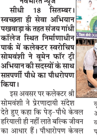
वृक्ष लगाने का कार्य नहीं, बल्कि आने वाली पीढ़ियों के लिए स्वच्छ वायु, शुद्ध जल और संतुलित पर्यावरण का बीज बोना है।