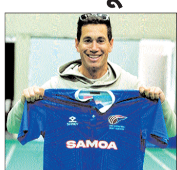
क्रिकेट टीम का प्रतिनिधित्व करूंगा। यह सिर्फ उस खेल में वापसी नहीं है, जिससे मुझे बहुत प्यार है। अपनी विरासत, संस्कृति, गांवों और परिवार का प्रतिनिधित्व करना मेरे लिए बहुत बड़े सम्मान की बात होगी। टेलर इसलिए समोआ के लिए खेलने की योग्यता रखते हैं, क्योंकि उनकी मां समोआ से आती हैं।

नई दिल्ली 6 सितम्बर. न्यूजीलैंड के लिए खेल चुके दिग्गज क्रिकेटर रॉस टेलर ने रिटायरमेंट से यू-टर्न ले लिया है। उन्होंने आईसीसी टी20 वर्ल्ड कप एशिया-ईस्ट एशिया पैसिफिक क्वालीफायर में न्यूजीलैंड के लिए नहीं बल्कि समोआ के लिए खेलने का निर्णय लिया है।