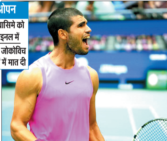
यूसुफ औपन सिन्नर अलियासिमे को हराकर फाइनल में अल्काराज ने जोकोविच को सीधे सेटों में मात दी

न्यूयॉर्क 6 सितम्बर. डिफेंडिंग चैंपियन यानिक सिन्नर और कार्लोस अल्काराज ने यूएस ओपन 2025 के फाइनल में जगह बना ली है, जिससे एक बार फिर टेनिस जगत की सबसे रोमांचक प्रतिद्वंद्विता देखने को मिलेगी। सेमीफाइनल में सिन्नर ने फेलिक्स ऑग्वर-अलियासिमे को 6-1, 3-6, 6-3, 6-4 से हराया, जबकि अल्काराज ने 24 ग्रैंड स्लैम विजेता नोवाक जोकोविच को सीधे सेटों में 6-4, 7-6 (4), 6-2 से मात दी। विश्व के नंबर एक खिलाड़ी सिन्नर ने सेमीफाइनल में 25वाँ वरीयता प्राप्त ऑग्वर-अलियासिमे के खिलाफ जोरदार जीत हासिल की। हालांकि, यह मैच उतना आसान नहीं था जितना स्कोरलाइन से लगता है। अलियासिमे ने शानदार प्रदर्शन करते हुए दूसरे सेट में वापसी की और सिन्नर को कड़ी टक्कर दी।