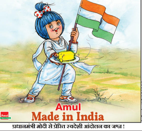
प्रधानमंत्री मोदी से प्रेरित स्वदेशी आंदोलन का जन्म!