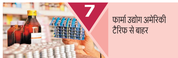
7 फार्मा उद्योग अमेरिकी टैरिफ से बाहर