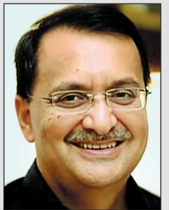
भारत-कनाडा रिश्तों में नई शुरुआत : पटनायक

नयी दिल्ली, भारत और कनाडा ने एक-दूसरे के लिए नए उच्चायुक्त नियुक्त कर संबंधों में नई शुरुआत की है। भारत की ओर से वरिष्ठ राजनयिक दिनेश के. पटनायक को कनाडा में उच्चायुक्त बनाया गया है। वे 1990 बैच के आईएफएस अधिकारी हैं और वर्तमान में स्पेन में भारत के राजदूत हैं। वहीं, कनाडा ने क्रिस्टोफर कुट्टर को भारत में अपना नया उच्चायुक्त नियुक्त किया है। कुट्टर 35 साल के कूटनीतिक अनुभव वाले अधिकारी हैं और 1998-2000 के बीच नई दिल्ली स्थित कनाडाई मिशन में भी कार्य कर चुके हैं। पिछले कुछ वर्षों में खालिस्तानी अलगाववाद और राजनीतिक बयानों के कारण दोनों देशों के संबंध तनावपूर्ण रहे थे। खासकर हरदीप सिंह निज्जर हत्या मामले में कनाडा के आरोपों के बाद रिश्तों में खटास गहराई।