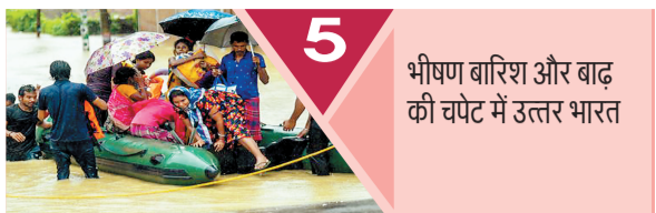
5 भीषण बारिश और बाढ़ की वजह से उत्तर भारत