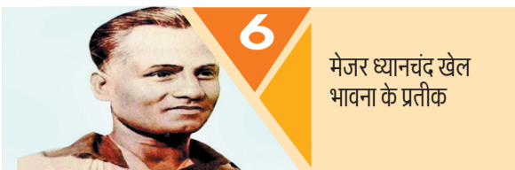
6 मेजर ध्यानचंद खेल भावना के प्रतीक