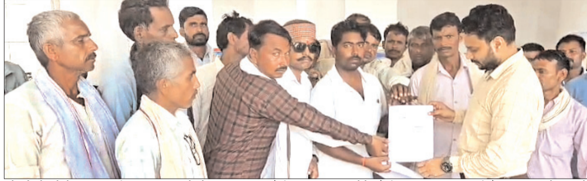
खोलने से लोगों का जन जीवन मुश्किल में पड़ जाएगा। इन आपत्तियों में वायु प्रदूषण, हैवी ब्लास्टिंग, पानी की कमी और फसल नष्ट होने जैसी समस्याएं शामिल हैं। ग्रामीणों ने प्रशासन से मांग की है कि इस परियोजना को तुरंत रोक दिया जाए और उनकी

सुनवाई में कलेक्टर को ज्ञापन दिया है। दरअसल, खेरवा में ग्रामीणों ने खनन एवं स्टोन केशर की स्वीकृति पर आपत्ति दर्ज की। इस दौरान ग्रामीणों ने कहा इस संचालित प्रोजेक्ट एवं खनन को बंद किया जाए। जन सुनवाई में अधिकारियों की मौजूदगी में ग्रामीणों ने विरोध जताते हुए कहा कि पहले से खेरवा में एक केशर संचालित है जिसके चलते ग्रामीणों को भारी परेशानी उठानी पड़ती है, अब दूसरा केशर