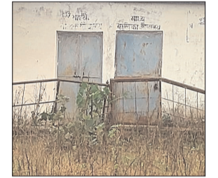
वांचित रहते हैं? शिक्षक विभाग की जवाबदार अधिकारी एवं कर्मचारी कभी फील्ड में नहीं जाते सिर्फ कामज में ही निरीक्षण होता है इसके बाद भी सरकार? पर आरोप लगा रहे हैं शिक्षक विभाग छात्र संख्या के आधार पर साफ सफाई का पैसा आता है कहा जाता है जांच का विषय है।

नवभारत न्यूज मझगवां 27 अगस्त। माध्यमिक विद्यालय खैरवार मझगवां जन शिक्षा केंद्र नकैला जनपद पंचायत मझगवां मुख्यालय 29 से लगभग 22 किलोमीटर दूर स्थित विद्यालय में शौचालय जब से बना आज तक नहीं खुला। यह शौचालय झाड़ियों के बीच बना है। छात्राओं के लिए बने शौचालय में ताला लटक रहा है? साफ सफाई का पैसा कहा जाता है इसका किसी का पता नहीं है जिसमें आज तक अधिकारियों की नजर नहीं पड़ी क्योंकि पिछड़ा क्षेत्र है यहां के बच्चे सुविधाओं से