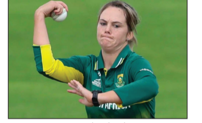
कितना मिस किया है और मैं एक बार फिर उस अवसर को पाने के लिए अपना सबकुछ देने के लिए पूरी तरह प्रतिक्रम हूँ। दक्षिण अफ्रीका महिला टीम का राष्ट्रीय प्रशिक्षण शिविर 25 अगस्त से डरबन में शुरू होगा और सितंबर तक चलेगा।

केपटाउन, 25 अगस्त ( वार्ता ) आगामी एकदिवसीय महिला विश्वकप से पहले संन्यास ले चुकी दक्षिण अफ्रीका की दिग्गज खिलाड़ी और पूर्व कप्तान डेन वैन नोकेर्क की 20 सदस्यीय टीम में शामिल किया गया है। अंतरराष्ट्रीय क्रिकेट से संन्यास 2023 में संन्यास ले चुकी डेन वैन नोकेर्क ने अपने सोशल मीडिया अकाउंट पर एक बयान में लिखा, मुझे यह घोषणा करते हुए बेहद खुशी हो रही है कि मैंने अंतरराष्ट्रीय क्रिकेट से संन्यास लेने के फैसला को वापस ले लिया है। इस समय ने मुझे याद दिलाया है कि मैंने अपने देश का प्रतिनिधित्व करना