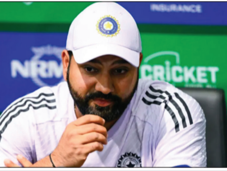
एकाग्रता और मानसिक ताजगी सबसे अहम

की औसत से 4301 रन बनाए. इससे एक साल पहले, टी20 विश्व कप जीतने के बाद उन्होंने क्रिकेट के सबसे छोटे प्रारूप से भी संन्यास ले लिया था. एकाग्रता और मानसिक ताजगी सबसे अहम रोहित के अनुसार, टेस्ट मैच में एकाग्रता सबसे महत्वपूर्ण होती है, क्योंकि इसमें बहुत कुछ करना पड़ता है. उन्होंने कहा, फ्रआप बहुत अच्छे प्रदर्शन की उम्मीद कर रहे होते हैं और उसके लिए मानसिक रूप से तरोताजा होना जरूरी है. बहुत सारा काम पर्दे के पीछे से शुरू होता है, जैसा कि मैंने कहा,