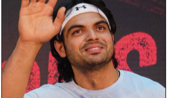
प्रतियोगिता 28 अगस्त को होगी. नीरज चोपड़ा का इवेंट स्थानीय समय के अनुसार शाम 7:45 बजे (भारतीय समयानुसार गुरुवार रात 11:15 बजे) शुरू होगा.

नई दिल्ली 25 अगस्त. डायमंड लीग फाइनल के लिए एंटी लिस्ट जारी कर दी गई है, जिसमें भारत के दो बार के ओलंपिक पदक विजेता नीरज चोपड़ा के साथ नोआ लाइल्स, जूलियन अल्फ्रेड और मोंडो डुप्लांटिस जैसे सुपरस्टार खिलाड़ी शामिल हैं. यह प्रतिष्ठित प्रतियोगिता 27 और 28 अगस्त को ज्यूरिख में होगी, जहां दो दिनों तक कड़ी प्रतिद्वंद्विता, रिकॉर्ड तोड़ने की कोशिश और रोमांचक दौड़ देखने को मिलेगी. भारतीय एथलेटिक्स प्रशंसकों के लिए सबसे बड़ा आकर्षण नीरज चोपड़ा का प्रदर्शन होगा. पुरुषों की भाला फेंक