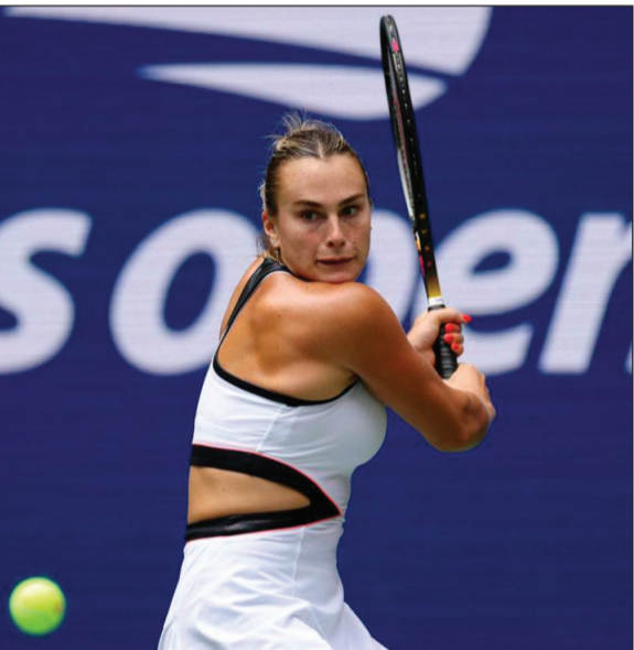
अगले दौर में कुदेरमेतोवा से मुकाबला