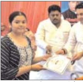
भारत-आत्मनिर्भर भारत सभी के सामने है। हम सब उनके संकल्पों के साथ जुड़कर उसे अपने जीवन का हिस्सा व मंत्र बनाएंगे और विकसित मध्य प्रदेश के विकसित त्योंथर में अपना योगदान सुनिश्चित करें।