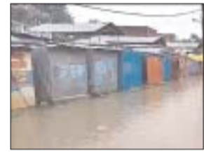
पानी नाले से निकल कर बाई 8

चुकी थी और चौहट्टा बाजार हर्दी मोड मार्ग पूरी तरह से बन्द हो चुका था तथा मण्डी की दुकानों व लोगों के घरों में पानी भराव होने से लोगों को भारी परेशानी का सामना करना पड़ा है। आपको बता दें कि नगर के बाई 10/11/8/ के बारिस का