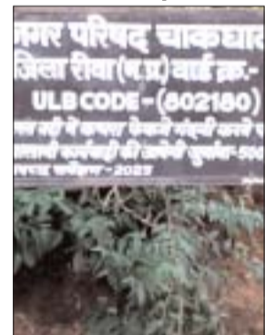
लगा है की नदी में गंदगी फैलाने वालों पर चालानी कार्यवाही की

दिन प्रतिदिन नगर में गंदगी का प्रकोप बढ़ता जा रहा है। चाकघाट की प्रमुख तमसा नदी में के तट पर जहां एक ओर नगर परिषद प्रशासन का सूचना बोर्ड