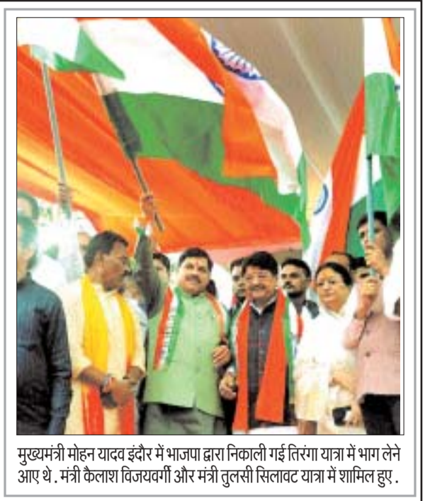
मुख्यमंत्री मोहन यादव इंदौर में भाजपा द्वारा निकाली गई तिरंगा यात्रा में भाग लेने आए थे. मंत्री कैलाश विजयवर्गी और मंत्री तुलसी सिलावट यात्रा में शामिल हुए.

भोपाल. मुख्यमंत्री डॉ. मोहन यादव के नेतृत्व में मप्र अपैरल और टेक्सटाइल सेक्टर में निवेश और वैश्विक बाजार तक पहुंच के नए द्वार खोलने जा रहा है. मुख्यमंत्री डॉ. यादव 14 अगस्त को देश और दुनिया के 15 से अधिक शीर्ष अपैरल एवं टेक्सटाइल ब्रांड्स के प्रतिनिधि एवं उद्योगपति मुख्यमंत्री निवास समल भवन में निवेश के संबंध में राउंड टेबल मीटिंग में संवाद करेंगे. बैठक में पीएम मित्रा पार्क सहित राज्य की अत्याधुनिक औद्योगिक अवसंरचना, कुशल श्रमशक्ति और रणनीतिक भौगोलिक स्थिति का विस्तृत प्रस्तुतीकरण किया जाएगा.