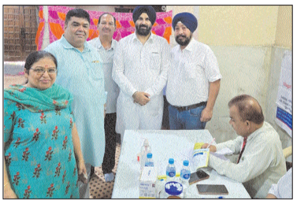
दिनों में संस्था ने 70 वर्ष से अधिक आयु के 300 से अधिक लोगों के लिए निःशुल्क आयुष्मान कार्ड बनवाए हैं।