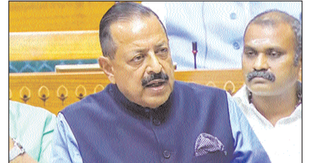
राष्ट्रीय एआई पहल और अनुप्रयोग

दिसंबर 2025 तक 15 भाषाओं का लक्ष्य कृषि, शासन और रक्षा में पायलट एप्लीकेशन