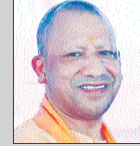
प्रदेश इकाई के अध्यक्ष की घोषणा के बाद भाजपा के राष्ट्रीय अध्यक्ष का निर्वाचन होगा, लेकिन अब संकेत मिल रहे हैं कि राष्ट्रीय अध्यक्ष का चुनाव होने के बाद ही उत्तर प्रदेश को नया नेतृत्व मिलेगा।

लखनऊ. सत्तारूढ़ भारतीय जनता पार्टी के नये प्रदेश अध्यक्ष के चुनाव को लेकर पिछले कई माह से चल रही अटकलें धमने का नाम नहीं ले रही हैं। बीजेपी ने अपने नए राष्ट्रीय अध्यक्ष का चुनाव फिलहाल टाल दिया है। इस पर सितंबर में होने वाले उपराष्ट्रपति चुनाव के बाद ही आगे का फैसला किया जाएगा। ये कदम 2024 के बाद बदले राजनीतिक हालात में पार्टी के अंदरूनी ढांचे को संभलकर छलाने की कोशिश के तौर पर देखा जा रहा है। पहले यह चर्चा थी कि उत्तर