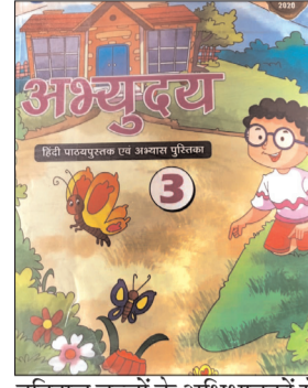
ननिहाल बच्चों के अभिभावकों से वसूले जाते हैं। तथा बेल्ट टाई जूते ड्रेस का भुगतान लेना अभी बाकी