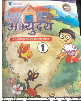
निर्धारित विद्यालयों से ही बच्चों को किताबें मिलनी चाहिए। अमरपाटन और रामनगर में

शैक्षिक सामग्री का प्रकाशन करता है। प्राइवेट स्कूलों में शिक्षा संचार से कहीं अधिक व्यापार संचालित हो चुका है। शासन प्रशासन के आदेश निर्देश रही कागज महज बना हुआ है। इन विद्यालयों की किताबों में जितने पेज ओभर, नहीं होते उससे कहीं अधिक उन पुस्तकों पर उनके दाम अंकित होते हैं। ये सिर्फ उन विद्यालयों में होते हैं जिनकी किताबें निर्धारित दुकानों तथा उन विद्यालय द्वारा सप्लाय की जाने वाली पुस्तकों में रहता है। जिनके उच्च दामों का