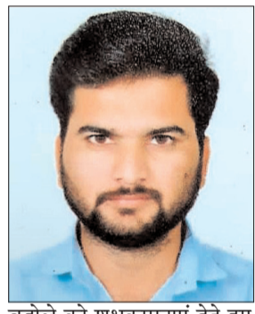
बडोले को शुभकामनाएं देते हुए उनके उज्ज्वल भविष्य की कामना

ग्रामीण उद्यानिकी विस्तार अधिकारी (आरएचईओ) भर्ती परीक्षा हुई थी