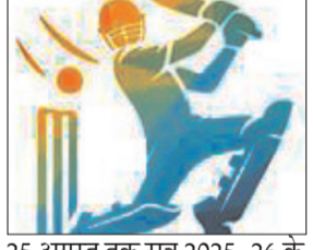
25 अगस्त तक सत्र 2025-26 के लिए क्रिकेट खिलाड़ियों के पंजीयन की प्रक्रिया की जायेगी। उन्होंने बताया कि इच्छुक क्रिकेट

नवभारत न्यूज मैहर 6 अगस्त। जिला क्रिकेट संघ मैहर में खिलाड़ियों के पंजीयन 7 अगस्त से प्रारंभ होगा जो आगामी 25 अगस्त तक जारी रहेंगे। जिला क्रिकेट संघ के सचिव ने बताया कि जिला क्रिकेट संघ एवं संभागीय क्रिकेट संघ द्वारा आयोजित होने वाली प्रतियोगिताओं में भाग लेने के लिए पंजीयन अनिवार्य है जिसमें