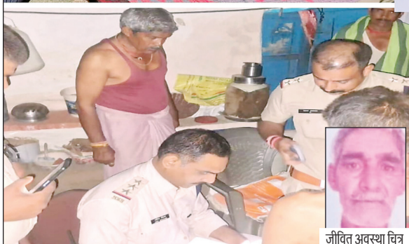
जीवित अवस्था में