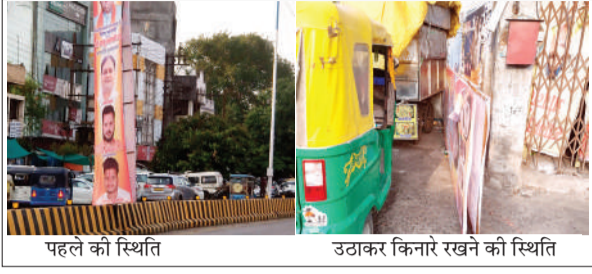
पहले की स्थिति

तीन पत्नी के पास का मामला जिम्मेदारों की कार्यशैली पर खड़े हो रहे सवाल