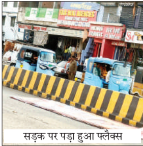
सड़क पर पड़ा हुआ फ्लैक्स

बाद उसने अपना वाहन रोका का फ्लैक्स को उठाकर किनारे रखा।