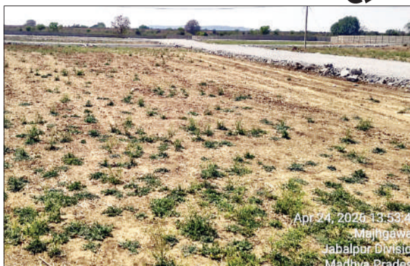
Apr 24, 2026, 13:53:47 Maha Jabalpur District Madhya Pradesh

नवभारत, कटनी। जिले में अवैध प्लांटिंग के खिलाफ प्रशासनिक सख्ती के दावों के बीच ग्राम बोहता में सामने आए मामले ने कई गंभीर सवाल खड़े कर दिए हैं। एक ओर जिला प्रशासन द्वारा प्राकृतिक जल स्रोतों, नदी-नालों और उनके आसपास विकसित हो रही अवैध कॉलोनियों की जांच के निर्देश दिए गए हैं, वहीं दूसरी ओर नेशनल हाईवे-30 बायपास से लगे बोहता क्षेत्र में कथित रूप से कृषि भूमि का स्वरूप बदलकर अवैध प्लांटिंग किए जाने के आरोप सामने आ रहे हैं।