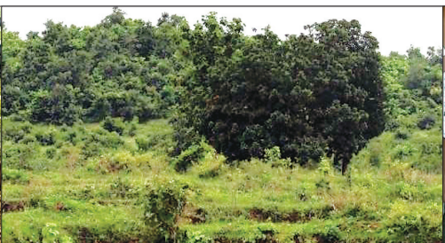
छिछरी रैयत सामुदायिक वन क्षेत्र

मंडला, नवभारत। जनपद पंचायत बिछिया के अंतर्गत आने वाली दो ग्राम पर्यावरण समितियों ने जैव विविधता संरक्षण के क्षेत्र में उत्कृष्ट कार्य कर पूरे मध्य प्रदेश में जिले का नाम रोशन किया है। मध्य प्रदेश राज्य जैव विविधता बोर्ड द्वारा घोषित वार्षिक जैव विविधता पुरस्कारों में जनपद बिछिया की ग्राम पर्यावरण समिति भानपुर खेड़ा को प्रदेश में द्वितीय और ग्राम छिछरी रैयत को तृतीय स्थान प्राप्त हुआ है। दोनों समितियों को राज्य स्तर पर नकद राशि और प्रशस्ति पत्र देकर सम्मानित किया गया है।