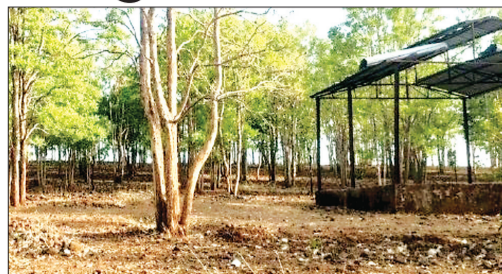
भानपुर खेड़ा, श्मशान घाट