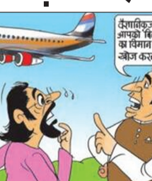
पेट्रोल रहित विमानों की उड़ान वैज्ञानिक दें इस ओर ध्यान

हुआ करती थी. धन के देवता कुबेर के पास पुष्पक विमान था जिसे उसके सोतेले भाई रावण ने छीन लिया था. कुबेर के अलकापुरी से वह विमान लंका लाया गया. रावण लंका से कैलाश पर्वत तक शिवजी का दर्शन करने उसी विमान से जाता था. रावण के मरने के बाद राम, सीता, लक्ष्मण को अयोध्या लौटाना था तो विभीषण ने पुष्पक विमान उपलब्ध कराया. वह आज के बोइंग 787 या मालवाही सी-130 हर्कुलिस विमान से भी बहुत विशाल था. उसमें हनुमान, अंगद, विभीषण और पूरी वानर सेना सवार हो गई थी. मन की शक्ति से चलने वाले पुष्पक विमान में कितने भी यात्री बैठ जाएं, एक सीट खाली बचती थी. यह लंका से अयोध्या तक की सीधी नॉनस्टॉप फ्लाइट थी. इसी तरह राम-रावण युद्ध में देवता विमानों से पुष्पवर्षा करते थे. वह श्रीकृष्ण पांडवों से मिलने हस्तिनापुर गए थे तब द्वारकापुरी पर मौका पाकर शाल्व ने हवाई हमला कर दिया था. इससे भारी तबाही हुई थी. श्रीकृष्ण ने लौटने के बाद शाल्व का संहार कर दिया था.