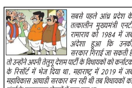
सबसे पहले आंध्र प्रदेश के तत्कालीन मुख्यमंत्री एनटी रामाराव को 1984 में जब अदंशा हुआ कि उनकी सरकार गिराई जा सकती है तो उन्होंने अपनी तेलुगु देशम पार्टी के विधायकों को कर्नाटक के रिसॉर्ट में भेज दिया था. महाराष्ट्र में 2019 में जब महाविकास आघाड़ी सरकार बन रही थी तब विधायकों को मुंबई के फाइवस्टार होटलों में रखा गया था.

चुनाव आयोग ने महाराष्ट्र सहित 6 राज्यों में विधानपरिषद चुनाव के लिए आधारसंहिता लागू की है. इसमें एक महत्वपूर्ण निर्देश दिया गया है कि इस चुनाव में मतदाताओं को होटल, रिसॉर्ट जैसे स्थानों में ले जाकर रखना रिश्वत देने जैसा भीतर अपराध माना जाएगा और ऐसे मामले में भारतीय दंड संहिता की धारा 171 ब के अनुसार कार्रवाई की जाएगी. यह देखा गया है कि किसी राज्य में राजनीतिक अस्थिरता पैदा होने पर पार्टी के विधायक, सांसद फूटकर दूसरी पार्टी में न चले जाएं इसलिए उन्हें किसी फाइव स्टार होटल या रिसॉर्ट में ले जाकर ठहरा दिया जाता है. सबसे पहले आंध्र प्रदेश के तत्कालीन मुख्यमंत्री एनटी रामाराव को 1984 में जब अदंशा हुआ कि उनकी सरकार गिराई जा सकती है तो उन्होंने अपनी तेलुगु देशम पार्टी के विधायकों को कर्नाटक के रिसॉर्ट में भेज दिया था. महाराष्ट्र में 2019 में जब महाविकास आघाड़ी सरकार बन रही थी तब विधायकों को मुंबई के फाइवस्टार होटलों में रखा गया था. 2022 में जब एकनाथ शिंदे ने शिवसेना में बगावत की थी तब उनके गुट के विधायकों को बीजेपी शासित राज्यों के गुवाहाटी, सुरत व गोंया जैसे स्थानों में ले जाकर पूरी सुविधाओं के साथ आलोचन तरीके से रखा गया