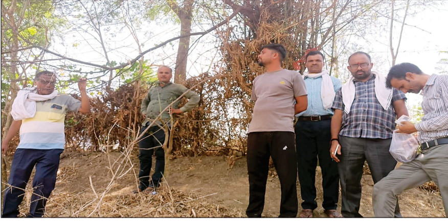
ग्रामीणों ने कहा, यह प्रशासन की लापरवाही ग्रामीणों का कहना है कि यदि समय पर कार्ड वितरित किए जाते, तो कई जरूरतमंद लोग इलाज का लाभ उठा सकते थे। इस घटना ने सरकारी कार्यपाली पर गंभीर प्रश्नचिह्न लगा दिया है।

नवभारत, हटा/दमोह। रनेह क्षेत्र में शासकीय स्वास्थ्य योजना को लेकर गंभीर लापरवाही का मामला सामने आया है। ग्राम पंचायत के समीप गडुवा तालाब की ओर जाने वाले नाले में करीब 74 आयुष्मान कार्ड पड़े मिले, जिससे स्थानीय लोगों में भारी आक्रोश है। वही आयुष्मान कार्ड हैं, जो गरीब एवं जरूरतमंद परिवारों को निशुल्क इलाज की सुविधा देने के लिए जारी किए जाते हैं। लेकिन इनका इस तरह नाले में मिलना न केवल प्रशासनिक लापरवाही को उजागर करता है, बल्कि यह भी सवाल खड़ा करता है कि क्या ये कार्ड कभी वास्तविक हितग्राहियों तक पहुंचे भी या नहीं। ग्राम पंचायत के समीप गडुवा तालाब की ओर जाने वाले नाले में करीब 74 आयुष्मान