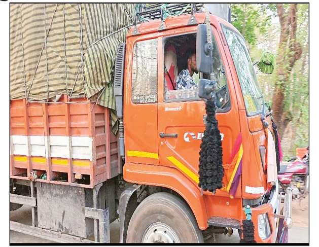
होता है एक अनुमान के मुताबिक यह मछली 70 प्रतिशत देशी मछलियों को समाप्त कर चुकी है, एनजीटी द्वारा इसके पालन विक्रय पर वेन किया गया है। मांगुर मछली के तेजी से वजन के साथ बढ़ने के कारण तस्क़र और बिक्रेत इसका उपयोग करते हैं।

मत्स्य विभाग और पटेरा पुलिस की संयुक्त कार्यवाही... जांच कार्यवाही जारी