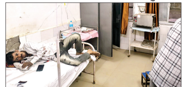
तलाश शुरू कर दी है। आसपास के क्षेत्र में लगे सीसीटीवी फुटेज खंगला जा रहे हैं ताकि वाहन और चालक की पहचान की जा सके।