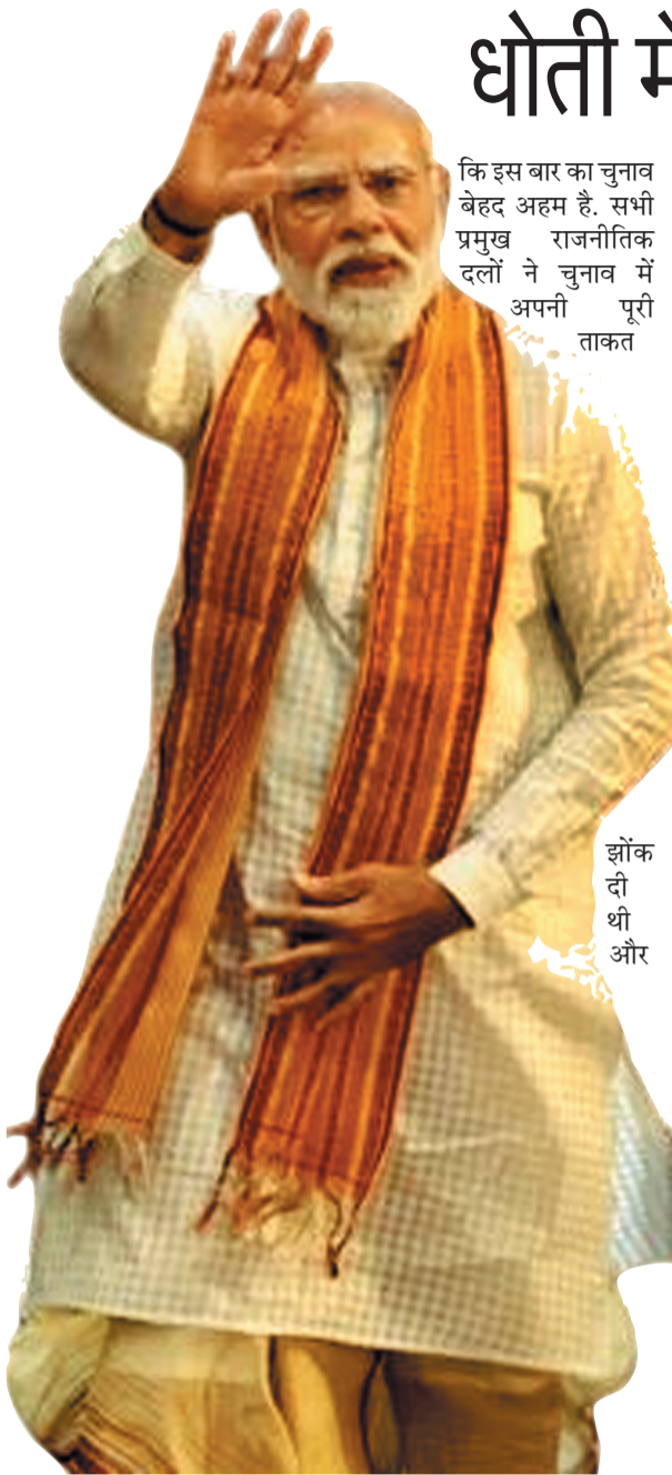
कोलकाता, 04 मई: पश्चिम बंगाल के अलग-अलग हिस्सों में हो रही जश्न इस बात का संकेत दे रही हैं

धोती में पीएम नरेंद्र मोदी, बंगाल-असम जीत पर भाजपा का भव्य जश्न