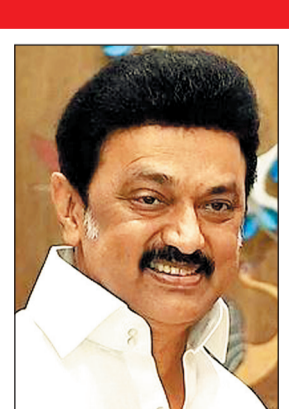
परिवर्तन लगभग तय है. यूडीएफ की इस बढ़त को कांग्रेस और उसके

जनता अब पारंपरिक राजनीतिक दलों से अलग विकल्पों को भी गंभीरता से ले रही है. विजय की लोकप्रियता पहले ही युवाओं और शहरी वोटर्स के बीच मजबूत मानी जाती थी, लेकिन इस चुनाव में ग्रामीण इलाकों में भी उनकी पार्टी को समर्थन मिला है. यही वजह है कि उनकी पार्टी इतनी बड़ी संख्या में सीटों पर आगे चल रही है. दूसरी ओर, केरल में भी सियासी समीकरण बदलते नजर आ रहे हैं. यूनाइटेड डेमोक्रेटिक फ्रंट ने बहुमत का आंकड़ा पार कर लिया है, जिससे यह साफ हो गया है कि राज्य में सत्ता