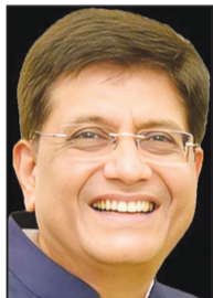
पीयूष गोयल केंद्रीय वाणिज्य और उद्योग मंत्री

भारत-न्यूजीलैंड मुक्त व्यापार समझौता (एफटीए) विकसित दुनिया के साथ की सहभागिता में एक महत्वपूर्ण मील का पत्थर है। यह वैश्विक आर्थिक साझेदारियों को किसानों, महिलाओं, युवाओं और रोजगार सृजक उद्योगों के लिए ठोस लाभ में बदलने से जुड़े प्रधानमंत्री नरेंद्र मोदी के दृष्टिकोण में हुई निर्णायक प्रगति को प्रतिबिंबित करता है। यह एफटीए प्रमुख विकसित अर्थव्यवस्थाओं, जिसमें यूनाइटेड किंगडम और यूरोपीय संघ शामिल हैं, के साथ हुए कई ऐतिहासिक व्यापार समझौतों के बाद हो रहा है। ये समझौते वैश्विक बाजारों में भारत की स्थिति को मजबूत करते हैं और निर्यातकों को दुनिया की कुछ सबसे लाभकारी अर्थव्यवस्थाओं में, यहां तक कि वर्तमान वैश्विक अनिश्चितता और उथल-पुथल के बीच भी प्रतिस्पर्धा आधारित बढ़त प्रदान करते हैं।