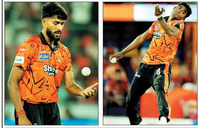
सनराइजर्स हैदराबाद के गेंदबाज रहे बेअसर