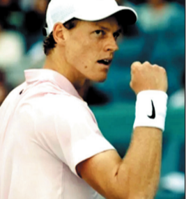
जीत हासिल की। गॉफ ने रोमानिया की 25वीं सीड वाली क्रिस्टिया के खिलाफ दूसरे सेट में मैडिकल टाइमआउट मांगा और जब उनसे पूछा गया कि उन्होंने मैच कैसे खेला, तो उन्होंने जवाब दिया: 'सच कहूं तो मुझे नहीं पता।' उन्होंने कहा: 'मुझे लगता है कि बदकिस्मती से मुझे भी वही मिला जो मैड्रिड में बाकी सबको हो रहा है, इसलिए, मैं बस कल के लिए कोशिश करूंगी। मुझे बेहतर महसूस होने लगा था, ऐसा नहीं लग रहा था कि मुझे उल्टी करनी है, उन्होंने मुझे कुछ गोलियां दीं, तो उससे निश्चिंत रूप से मदद मिली। लेकिन मैं सच में बहुत थक गई थी... पहला हिस्सा सचमुच बस जो कुछ भी मैंने खाया था उसे निगलने की कोशिश करना था।

मैड्रिड, 27 अप्रैल. अमेरिका की दिग्गज टेनिस खिलाड़ी कोको गॉफ ने बीमारी से जूझते हुए एक सेट और एक ब्रेकडाउन से वापसी करते हुए सोराना क्रिस्टिया को हराते हुए मैड्रिड ओपन के अंतिम 16 में जगह बना ली है। वहीं पुरुष वर्ग में जैनिफ सिनर ने एल्बर मोलर पर जीत दर्ज करते हुए टूर्नामेंट के अगले दौर में पहुंच गये हैं। मुकाबले के दौरान अमेरिका की तीसरी सीड गॉफ पेट के संक्रमण से जूझती रही और उन्हें दूसरे सेट के बीच में कूड़ेदान में उल्टी करनी पड़ी, उन्होंने ने वापसी करते हुए रोमानिया की सोराना क्रिस्टिया पर 4-6, 7-5, 6-1 से